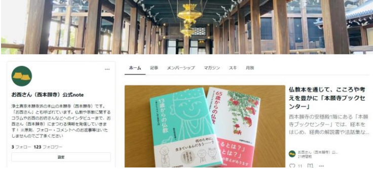
お西さん公式noteトップページ

魅力ある情報を発信するため、公式noteを開設いたしました。仏教や宗教に関するコラム、お西のお坊さんなどへのインタビューを掲載しています。そのほか西本願寺では、公式X（旧Twitter）〈お西さん（西本願寺）X：フォロワー約1万人〉、公式Instagram〈お西さん（西本願寺）Instagram：フォロワー約1,700人〉、公式YouTubeチャンネル〈お西さんの常例布教：登録者約3,600人・お西さんの法要行事：登録者約3,200人〉と、SNSの運用をしています。Xは開設から約6年が経過し、フォロワーがついに1万人を超え、YouTubeでは朝のお勤めの生配信が始まるなど、情報を積極的に発信しています。ぜひフォローをお願いいたします。