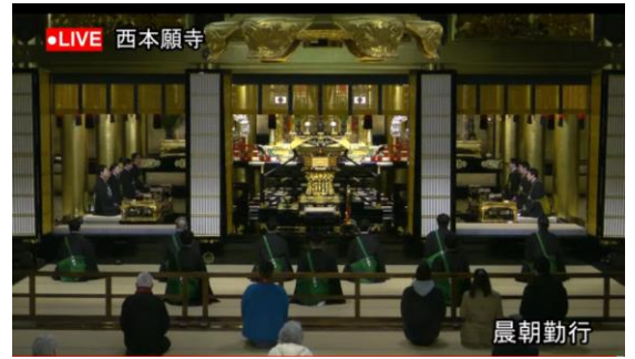
YouTube晨朝ライブ配信の様子

参考URL：お西さん（西本願寺）公式note https://note.com/nishi_hongwanji