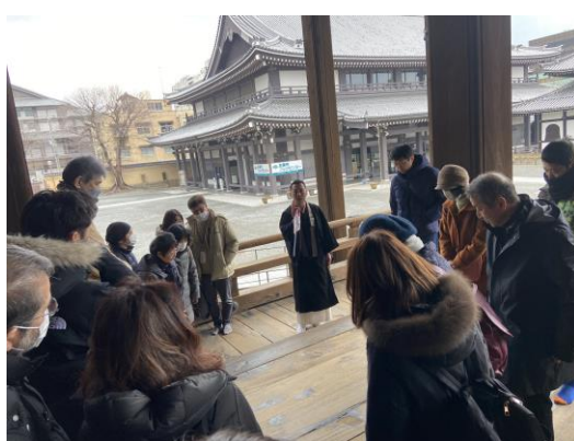
お西のお坊さんによる境内ツアー「お西さんを知ろう！」の様子