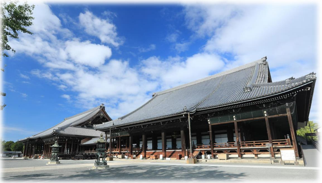
御影堂（奥）・阿弥陀堂（手前）

1994（平成6）年12月「古都京都の文化財」として、世界文化遺産に登録されました。