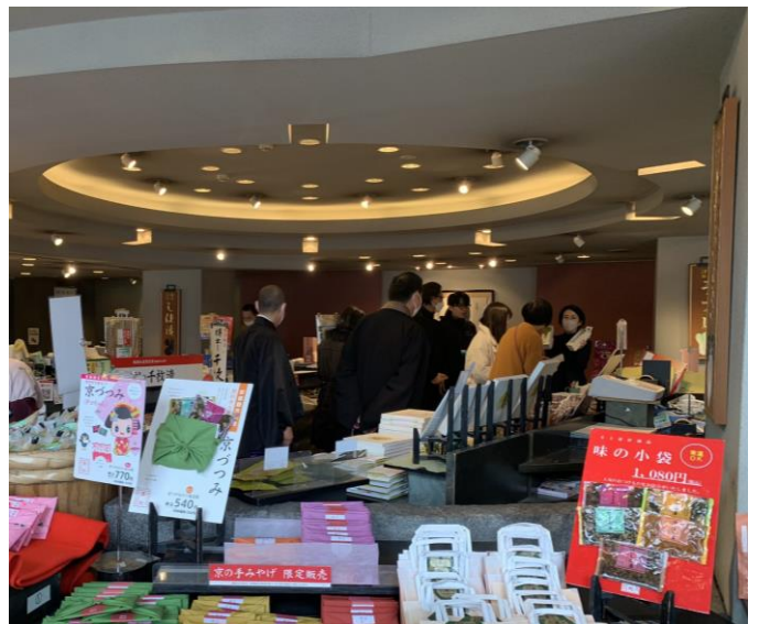
「お西さんざっと！ハンケイ500m」 創刊号表紙（左）