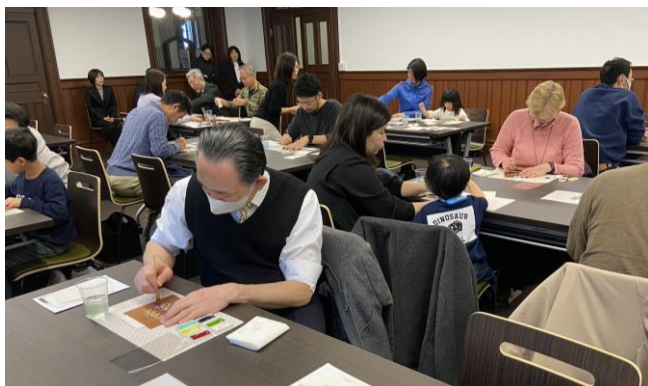
TERAKOYAHONGWANJI4月開講分チラシ（左） TERAKOYAHONGWANJI1月開講「和紙はがきづくり」の様子（上）